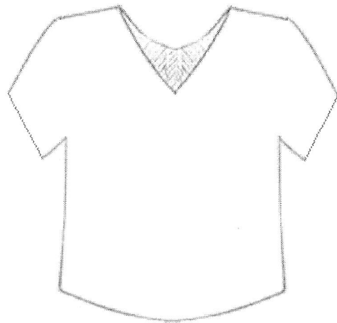
а) Вид модели спереди