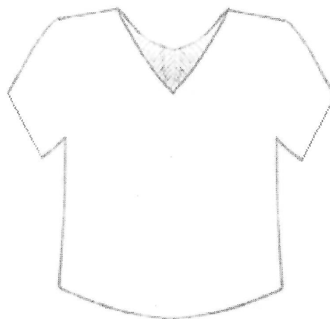
а) Вид модели спереди